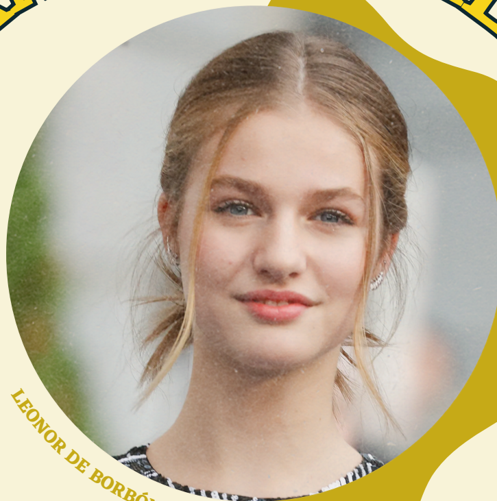
LEONOR DE BORBÓN Y ORTIZ

Felipe VI pertenece a la familia real española. Está casado con la reina consorte Letizia Ortiz Rocasolano (antigua periodista) desde 2004, y tienen dos hijas: la princesa Leonor, heredera al trono, y la infanta Sofía. La familia real desempeña un papel representativo en España y está involucrada en diversas actividades oficiales y ceremoniales.