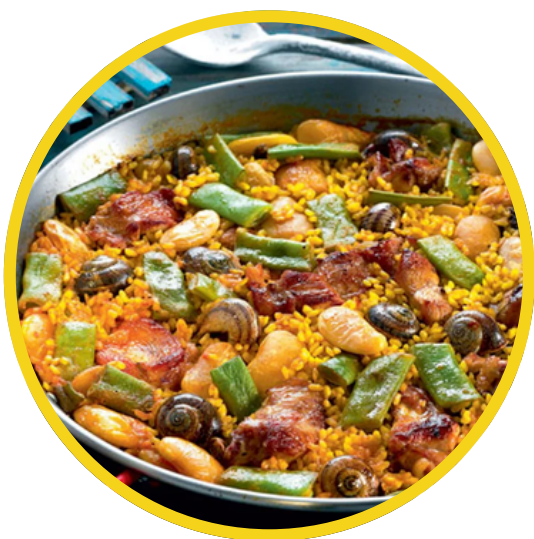
paella de caracol y carne