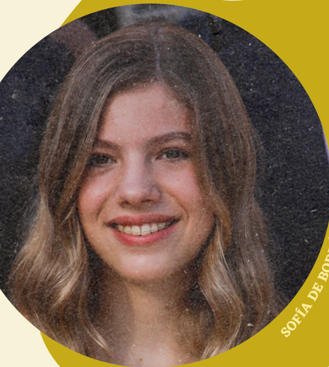
SOFÍA DE BORBÓN Y ORTIZ