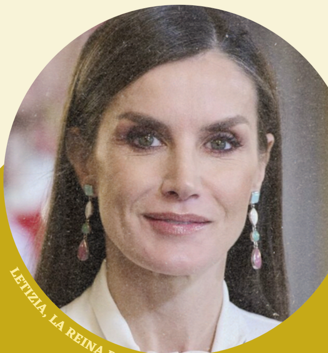
LETIZIA, LA REINA DE ESPAÑA